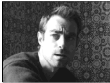
Propos recueillis par Cyril Neyrat

Pour trois raisons. Premièrement, tout spectateur éprouve un sentiment de retour en arrière dans le récit lorsqu'il voit un personnage dans une situation identique à deux moments distincts et éloignés l'un de l'autre. Ce dispositif permettait d'atténuer ce sentiment chez le spectateur car le ciel est changeant, jamais tout à fait le même. Deuxièmement, je voulais opposer le récit à la situation, l'intimité de la cellule et un paysage baigné de soleil. C'était convoqué l'opposition. Troisièmement, c'était une forme de respect à l'égard des anciens détenus. La profondeur de champ, le cadre, les feuilles des arbres agitées par le vent font vivre l'espace entre l'objectif et le sujet. Les ciels mettent en scène la parole de ces hommes pour ce qu'elle est, une pensée en mouvement. Et pour conclure, ces plans de paysages créent une complicité de regard entre les anciens détenus et le spectateur.