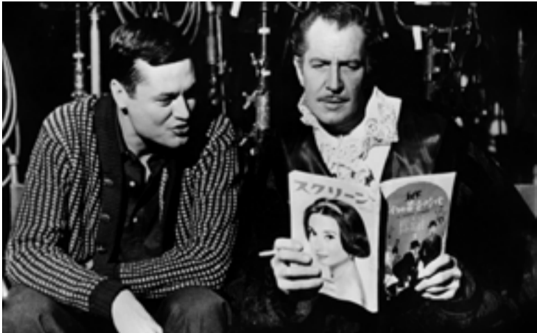
Roger Corman avec Vincent Price, sur le tournage de The Masque of the Red Death

ENTRÉE LIBRE / NAVETTES DU FID GRATUITES, DÉPART QUAI DU PORT FACE À L'HÔTEL DE VILLE À 19H45 ET 20H45 21H30 AU THÉÂTRE SILVAIN